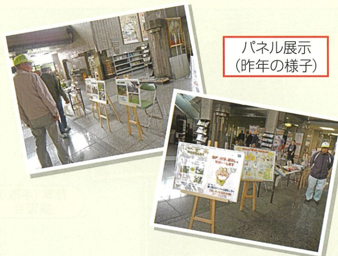
パネル展示(昨年の様子)

例年、シルバーの日として10月に多くの会員の方々によるボランティアに参加していただき、清掃活動を実施していただきましたが、コロナ禍により中止といたしました。 なお、市役所1階エントランスホールで10月26日(月)から30日(金)の5日間にシルバー人材センターの活動や会員増強のためのパネル展を行います。