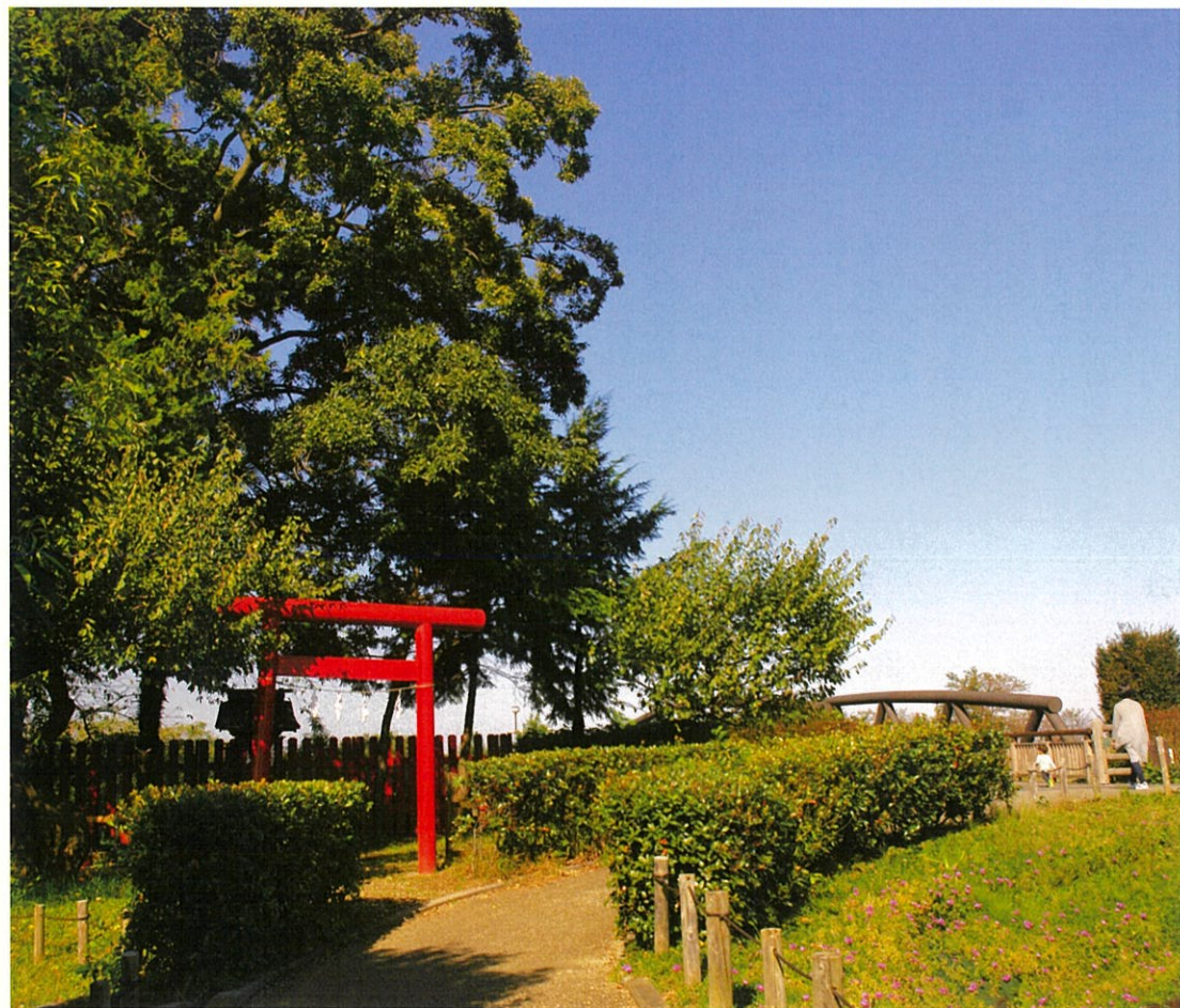
秋空の小さなお社“上郷大藪稲荷”