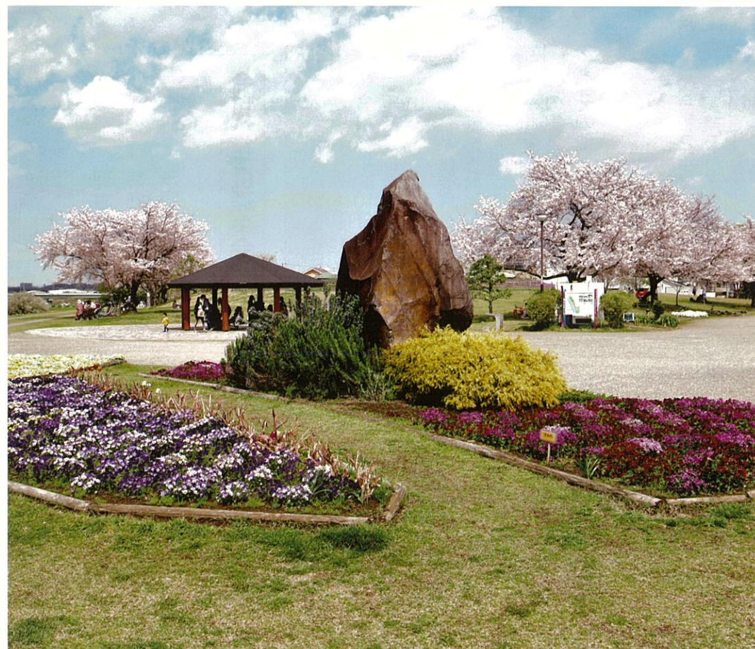
“春うらら(相模三川公園)”