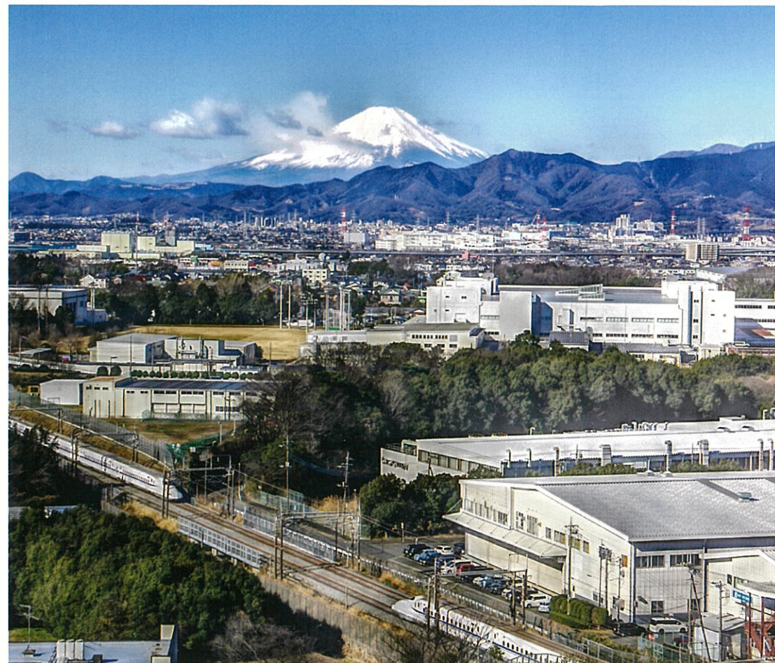
本郷地区から望む「霊峰富士と丹沢連峰」