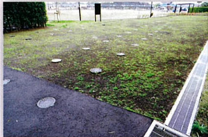
マンホールトイレ (64基) マンホールの上に便座と囲いを設置すると簡易トイレになります