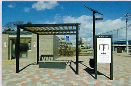
防災パーゴラ (2基) テントを取り付けると一時避難所や救護施設になります