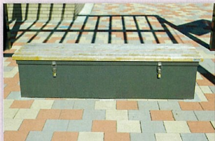
かまどベンチ (3基) 座面を外すと炊き出し用のかまどに変身します