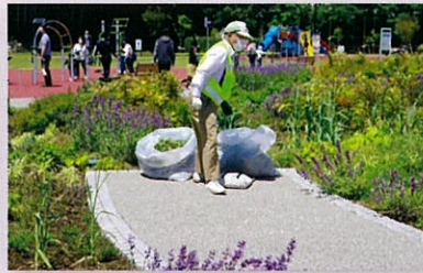
ここにも、シルバー会員の長年培った「就業力」を見たような気がしません。