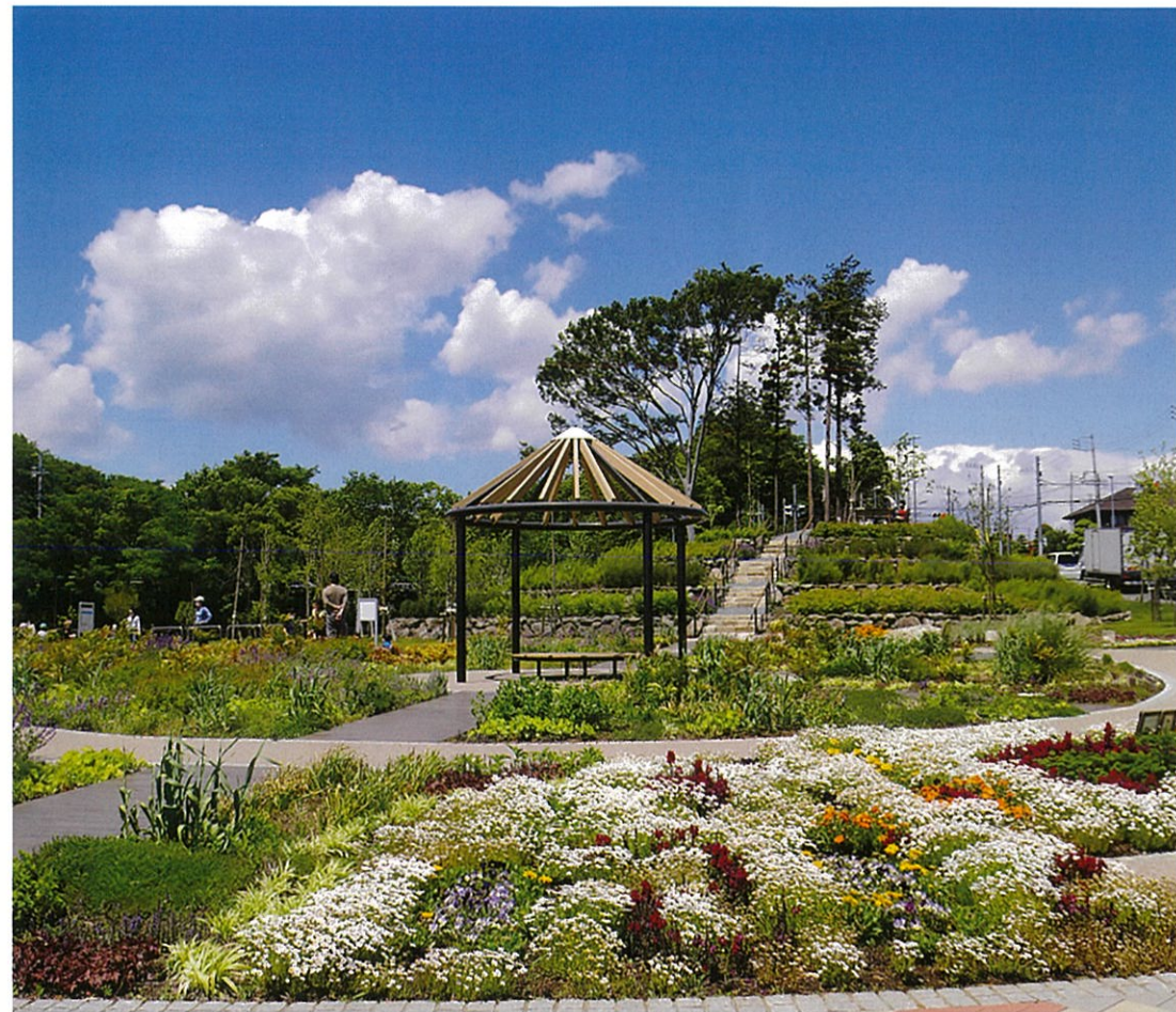
“春らんまん(本郷ふれあい公園)”