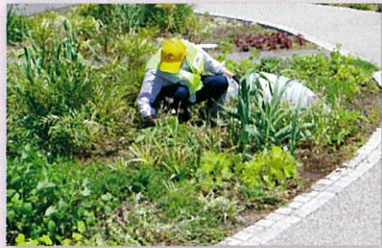
花壇の水やりや除草作業も行う

防災設備を兼ね備えた「本郷ふれあい公園」 今年(2011年)3月11日の東日本大震災から11年経過したことになります。「十年一昔」といいますが、東日本大震災を生々しく記憶されている方も多いことと思います。また、あの惨事を目のあたりにして、非常時の防災設備等の重要性を実感した方も多いかと思 今年(2011年)3月11日の東日本大震災から11年経過したことになります。「十年一昔」といいますが、東日本大震災を生々しく記憶されている方も多いことと思います。また、あの惨事を目のあたりにして、非常時の防災設備等の重要性を実感した方も多いかと思 今年(2011年)3月11日の東日本大震災から11年経過したことになります。「十年一昔」といいますが、東日本大震災を生々しく記憶されている方も多いことと思います。また、あの惨事を目のあたりにして、非常時の防災設備等の重要性を実感した方も多いかと思