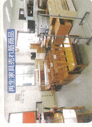
再生家具売れ筋商品