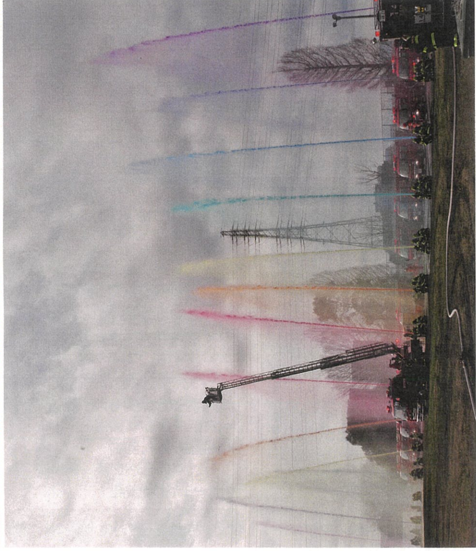
“新年彩る「海老名市消防出初式」”