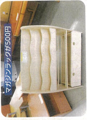
マガジンラックが500円