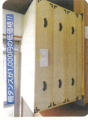
桐タンスが1,000円の低価格!!