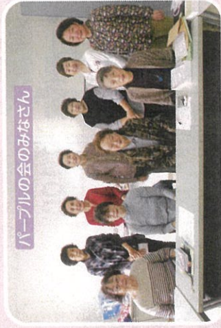
パープルの会のみなさん