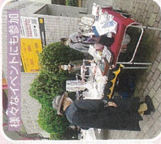
様々なイベントにも参加