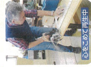
心をこめて再生中