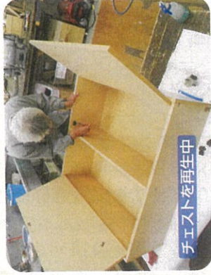
チェストを再生中