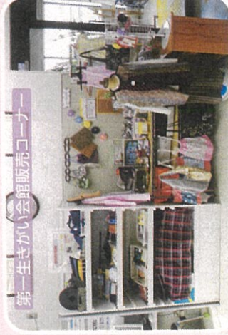
第一生きがい会館販売コーナー

手芸好きの会員が集まり、平成22年より自主事業として「パープルの会」を立ち上げ、月一回集まり活動しています。作製した小物品は、第一・第二生きがい会館のほか、海老名市役所内でもしおショップはれつとでも展示販売しています。また、市内でイベントがあれば、積極的に出店し会員が直接販売もしています。購入された方に喜んで頂けることが何よりのやりがいとなっています。