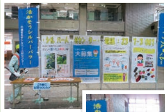
パネル展示 （昨年の様子）

市役所1階エントランスホールで10月23日（月）から30日（月）の8日間にシルバー人材センターの活動アピールや会員増強のためのパネル展示を行います。