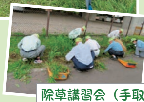
除草講習会（手取り）