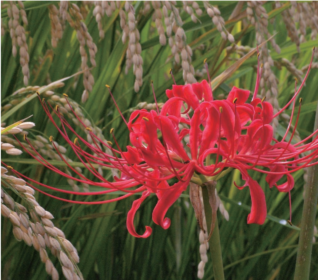
“実りの秋～稲穂と曼珠沙華～”