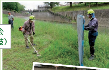
除草講習会 (刈払機実技)