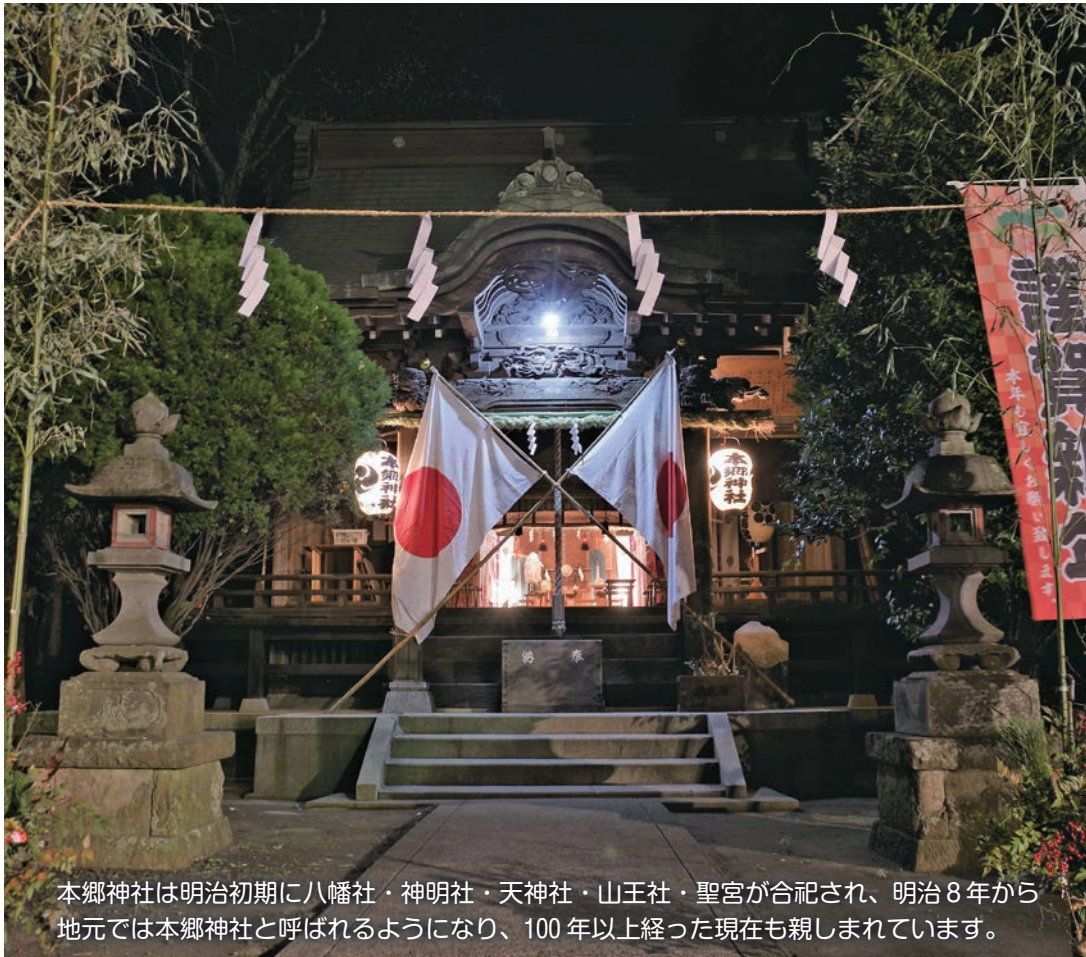
“新しい年を迎える本郷神社”