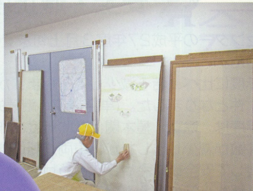
襖張り（障子・網戸も張替えやっています。）