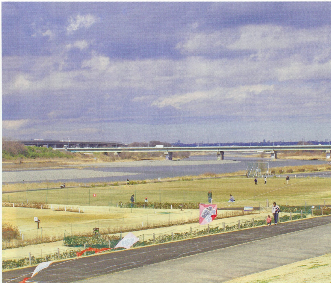
“三川公園付近の河川敷”