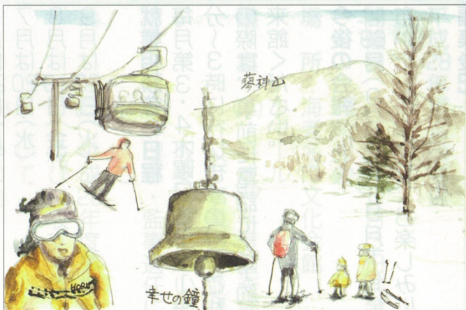
イラスト：堀井会員

今年も白樺高原国際スキー場へ行きました。 頂上は「幸せの鐘」があり、夢科山を眺めながら鳴らすと幸せに。調子に乗って鳴らしすぎると不幸に？欲張りは禁物です。 頂上から周囲を眺めるだけで十分気分転換になります。そして夜の会は大いに盛り上がりました。スキー未経験の方もご参加を。