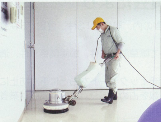
ポリッシャーによる施設清掃