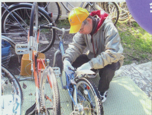
自転車のリサイクル