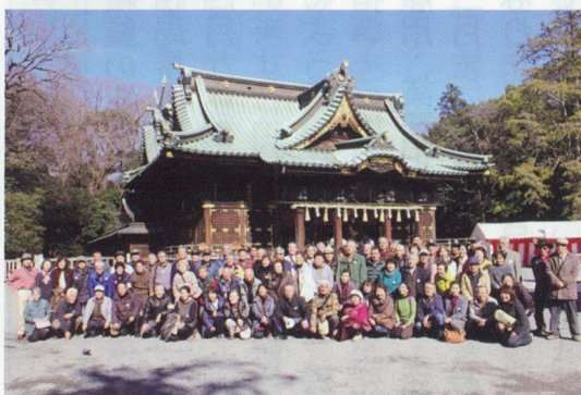
三嶋大社にて（全員でハイチーズ）

会員親睦旅行も第3回目、今回はバスの乗り場を数ヶ所増やし、参加者の方には喜んでいただけました。お天気に恵まれ84名で出発しました。 新名所の三島大吊橋や、三嶋大社、葦山反射炉を見学し、イチゴ狩りではおいしいイチゴをたくさん食べました。バス車内もビンゴ等楽しみながら、事故もけがもなく皆様笑顔で無事に旅行が終了しました。ありがとうございました。 また、地区長・班長にも大変ご協力いただき、ありがとうございます。