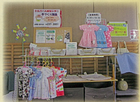
ともしびショップぱれっと 海老名市役所 1 階

8月1日より「ともしびショップぱれっと」、9月1日から「えび〜にゃハウス」の二か所にて自主事業小物品の販売を始めました。 人の往来が非常に多い場所なので多くの方にシルバーの存在をPRする絶好のポイントです。 皆様もお出かけの際には是非覗いてみてください。