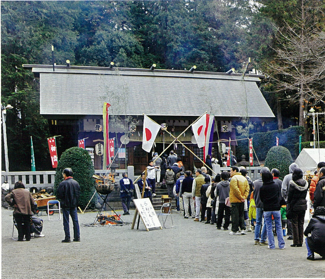
写真は「豊受神社 初詣」

H28年10月末現在 会 男子 711人 員 女子 184人 数 合計 895人