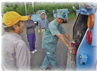
塵芥車は操作を誤ると非常に危険！