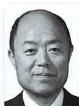
越前市長 奈良 俊幸