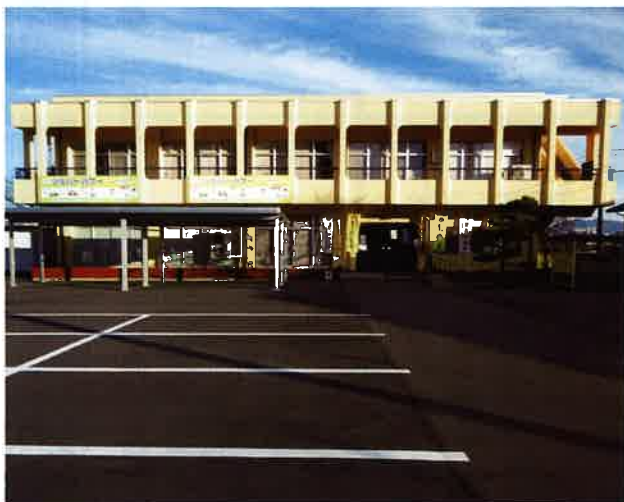
越前市国高労働福祉センター

当初は4月に開所式を催す予定でしたが、新型コロナウイルス感染拡大を受け中止になりました。新型コロナウイルス感染の第一波が落ち着いた6月に奈良市長、小泉産業環境部長が来所され、改装された新事務所を視察されました。