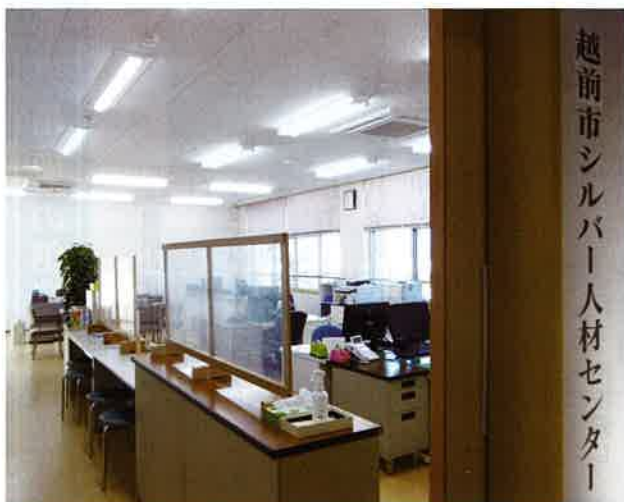
シルバー人材センター事務所(2階)