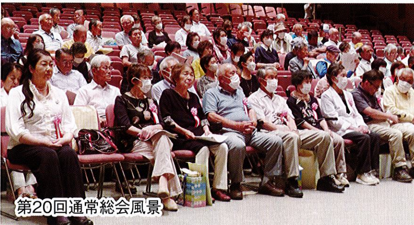
第20回通常総会風景