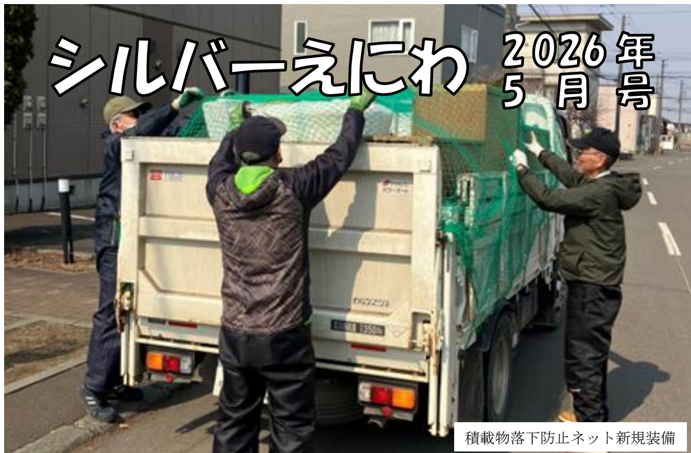
積載物落下防止ネット新規装備