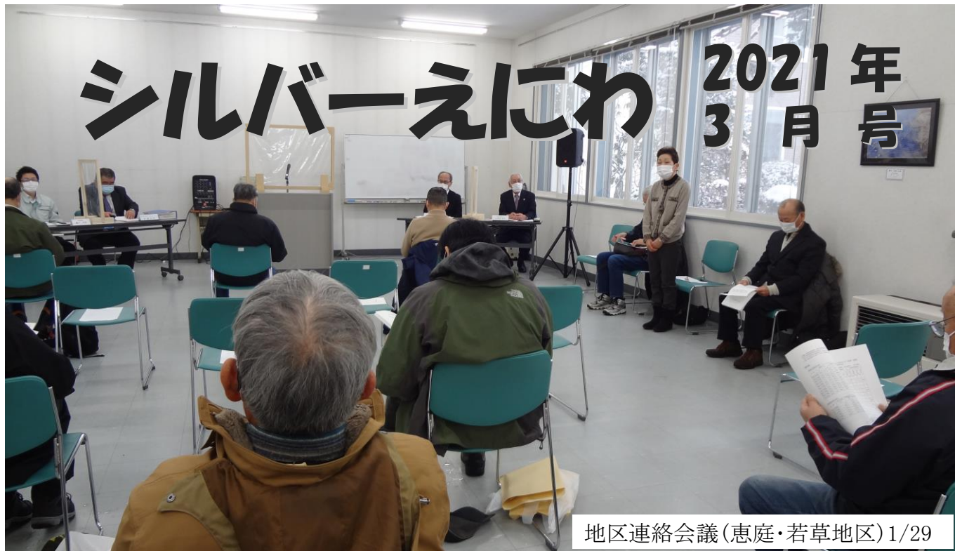
地区連絡会議(恵庭・若草地区) 1/29