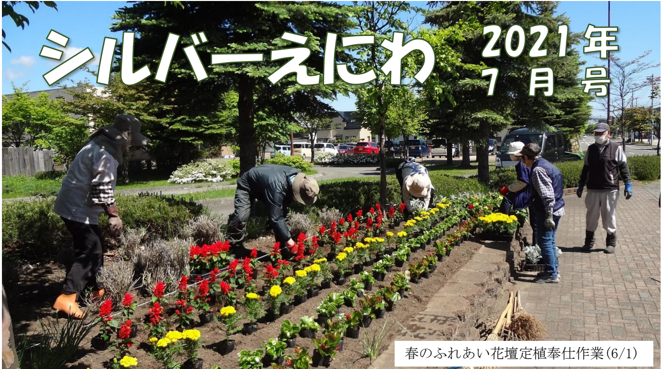
春のふれあい花壇定植奉仕作業(6/1)