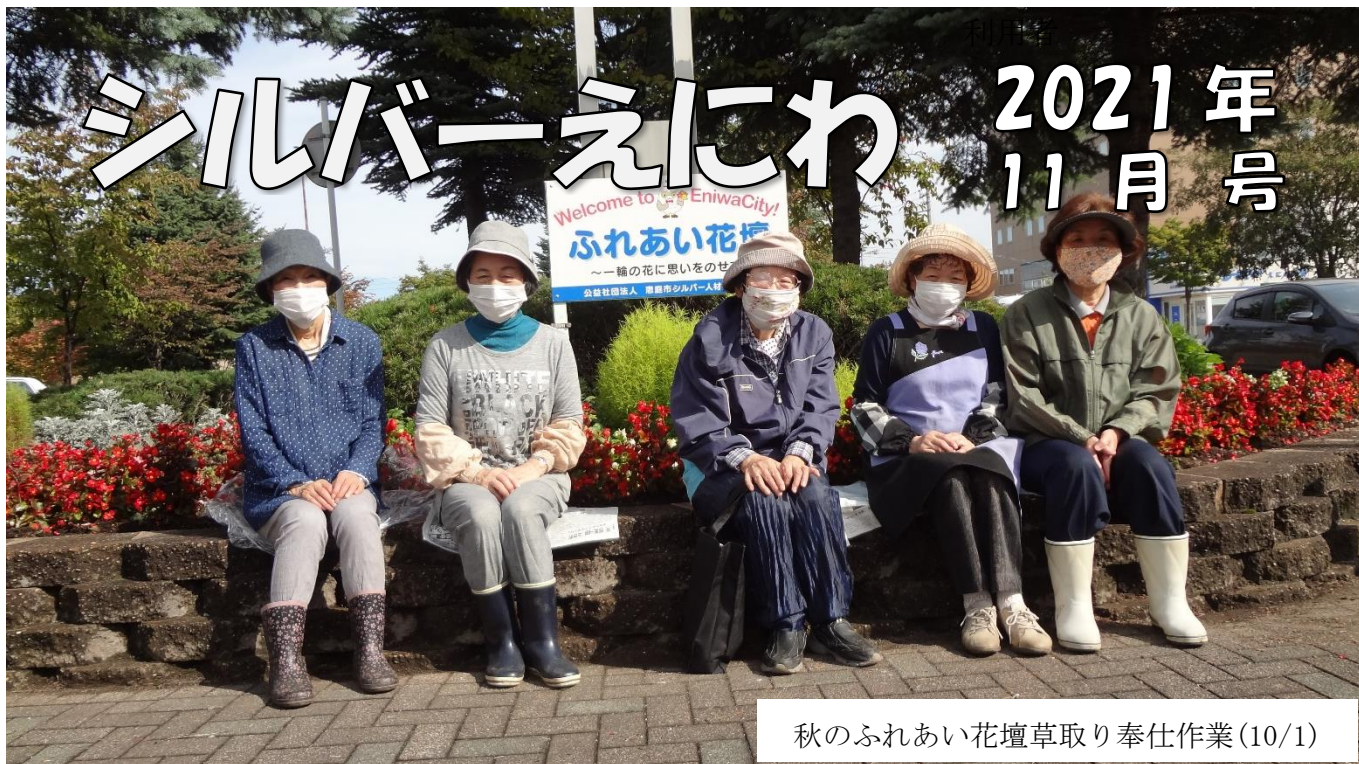
秋のふれあい花壇草取り奉仕作業(10/1)