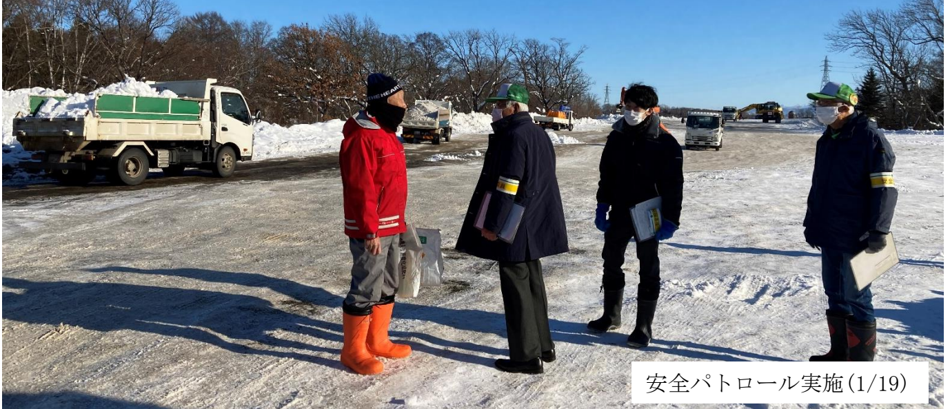
安全パトロール実施(1/19)