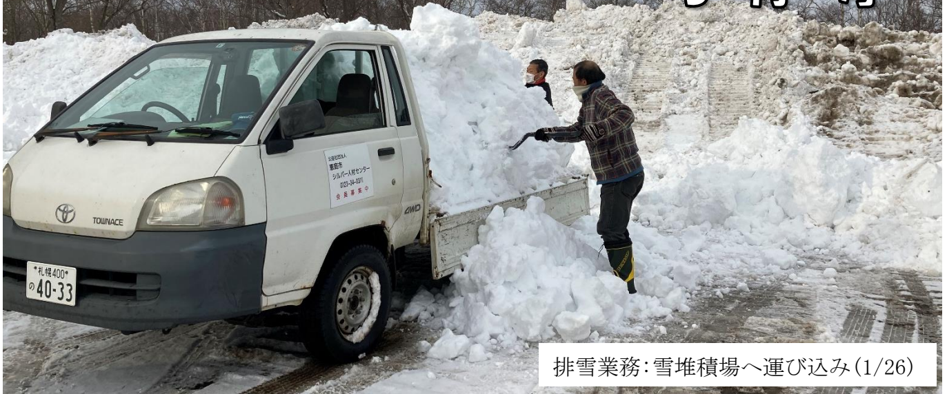
排雪業務: 雪堆積場へ運び込み (1/26)