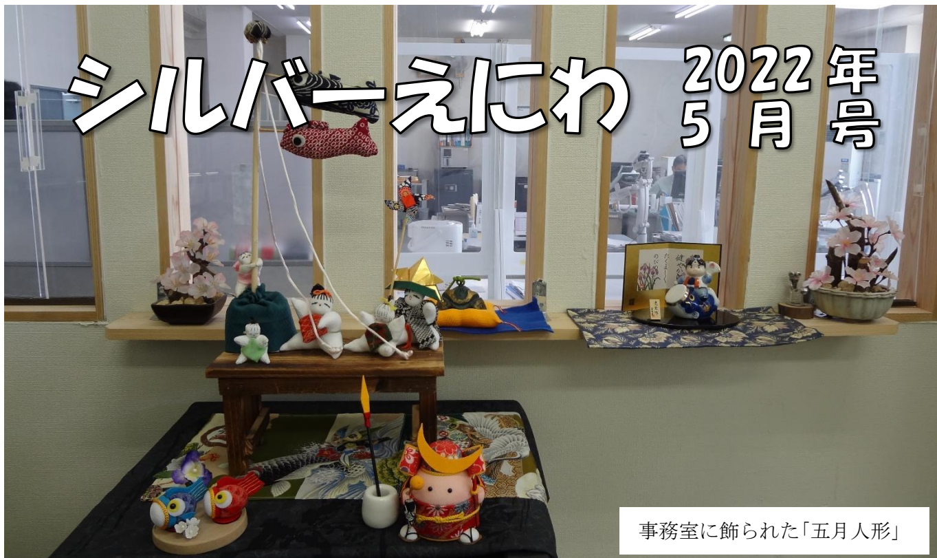
事務室に飾られた「五月人形」