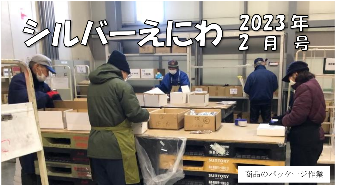
商品のパッケージ作業