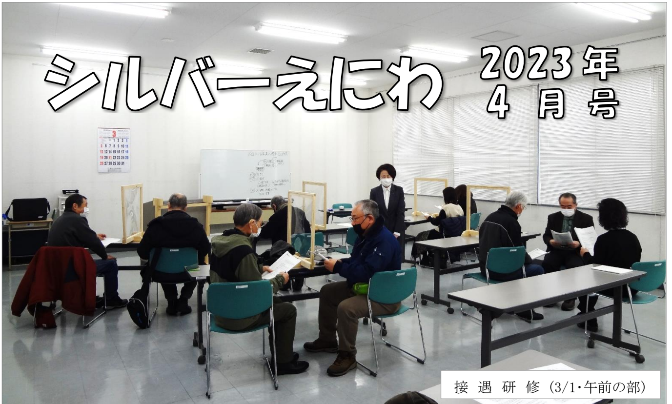
接 遇 研 修 (3/1・午前の部)