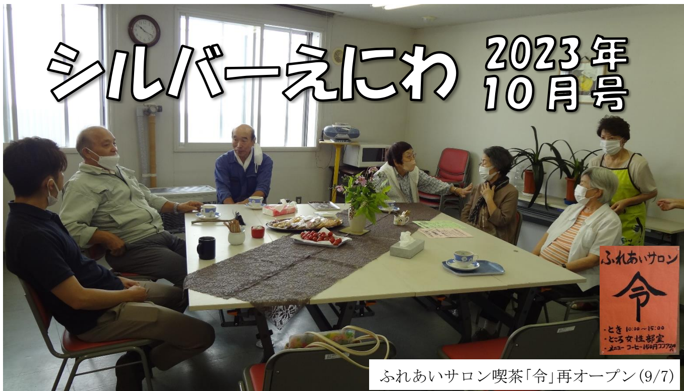
ふれあいサロン喫茶「令」再オープン(9/7)