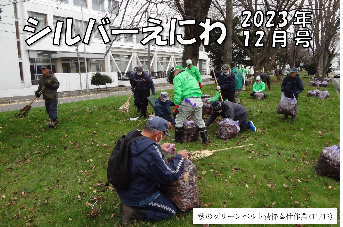
秋のグリーンベルト清掃奉仕作業(11/13)