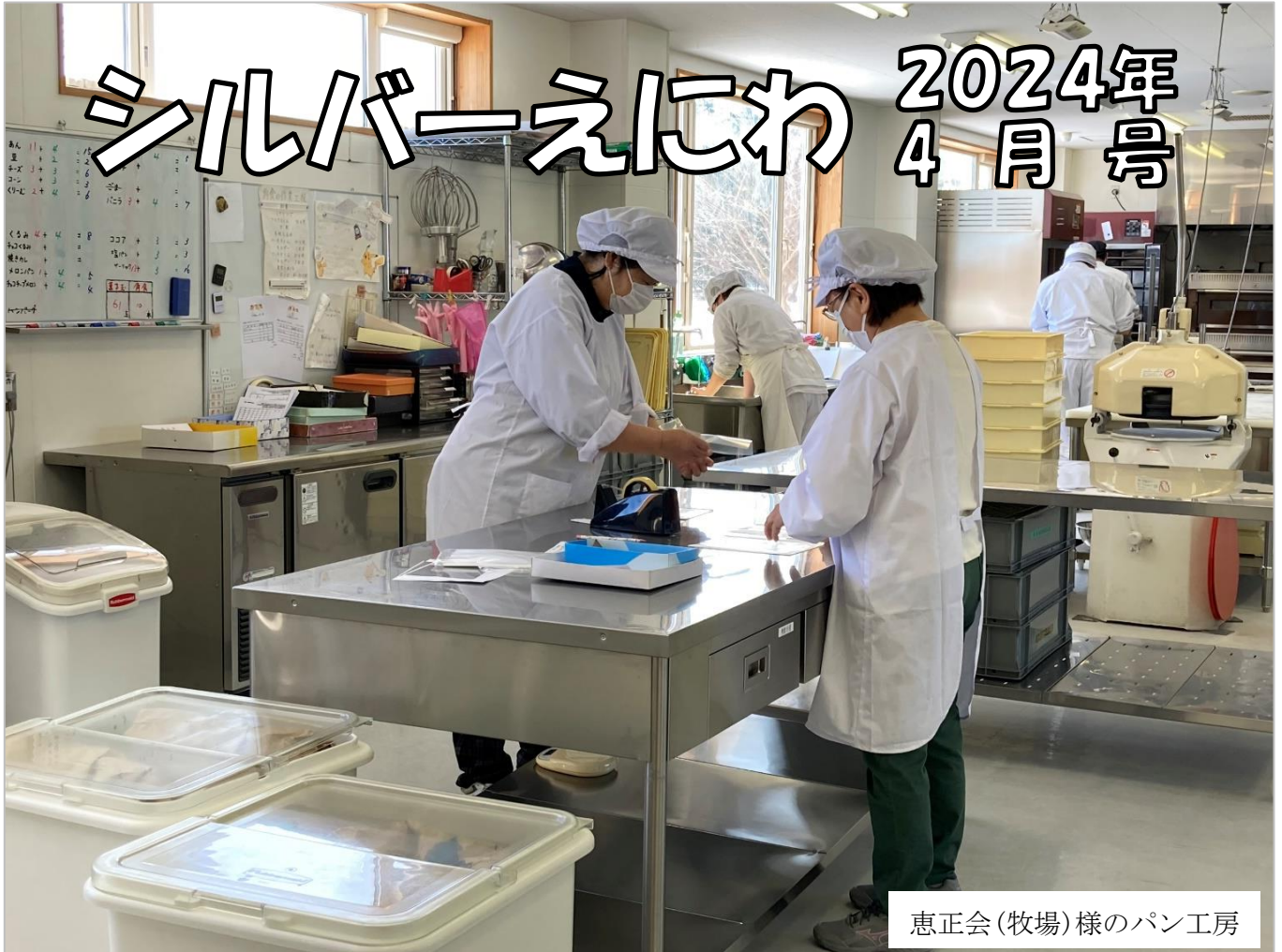
恵正会(牧場)様のパン工房

公益財団法人 恵庭市シルバー人材センター 第 326 号 令和 6 年 4 月 1 日発行