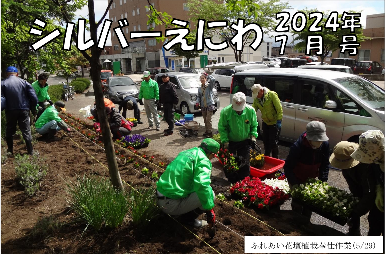
ふれあい花壇植栽奉仕作業(5/29)

公益財団法人 恵庭市シルバー人材センター 第 329 号 令和 6 年 7 月 1 日発行