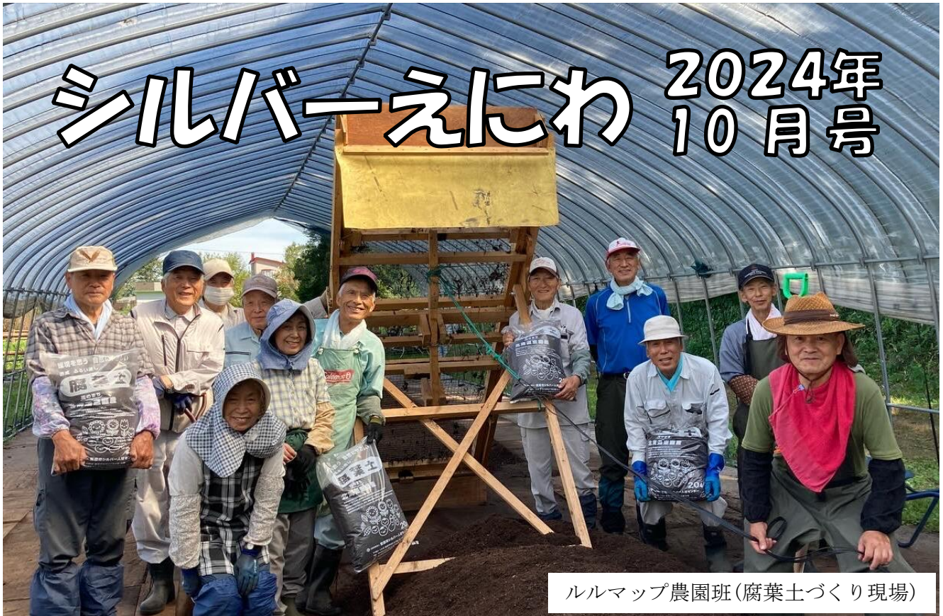
ルルマップ農園班(腐葉土づくり現場)