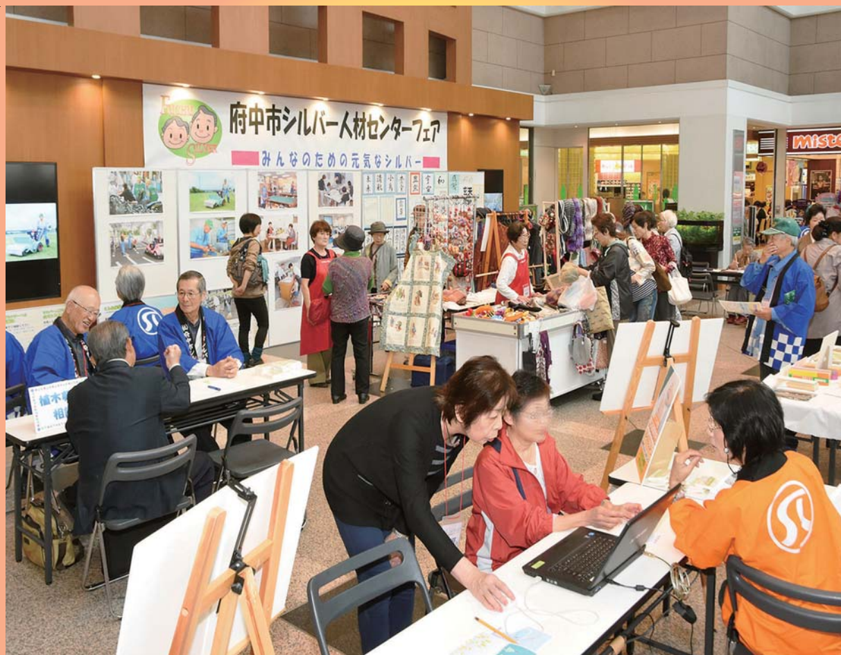
府中シルバー人材センターフェア開催（フォーリス1階 光と風の広場）

公益社団法人府中市シルバー人材センター発行/府中市寿町3-2 ふれあい会館2F/TEL042-366-2322