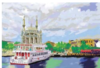
徳田豊彦さん「ボスポラス海峡」: パソ コン水彩