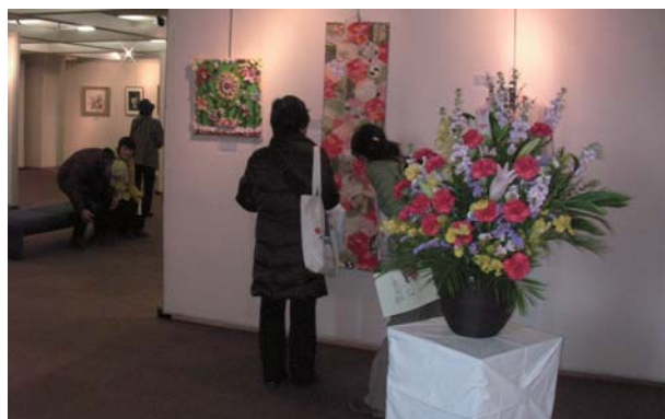
第2回ふれあい作品展