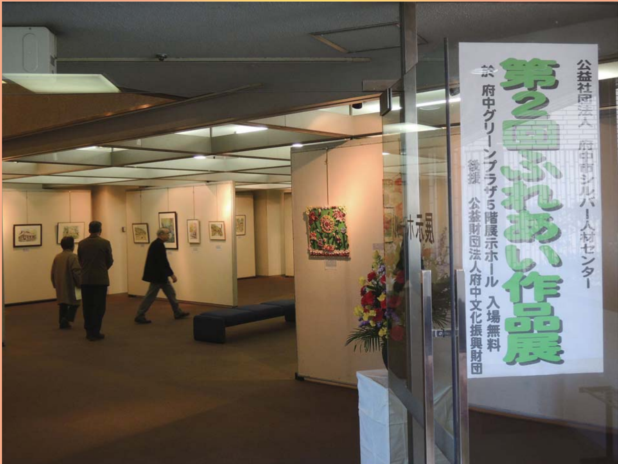
第2回「ふれあい作品展」

公益社団法人府中市シルバー人材センター発行/府中市寿町3-2 ふれあい会館2F/TEL.042-366-2322