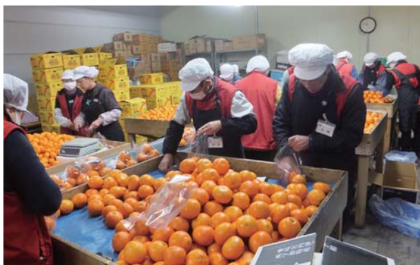
みかんパッケージ作業