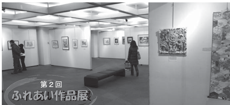
第2回 ふれあい作品展

ました。 平成25年度の第3回「ふれあい作品展」は、平成26年2月28日（金）～3月3日（月）までの4日間、府中グリーンプラザ5階展示ホールで開催します。充実した作品展を目指しますので、60歳以上の多数の市民の方々の出展を期待します。