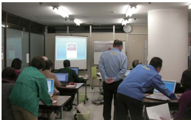
パソコン無料講習