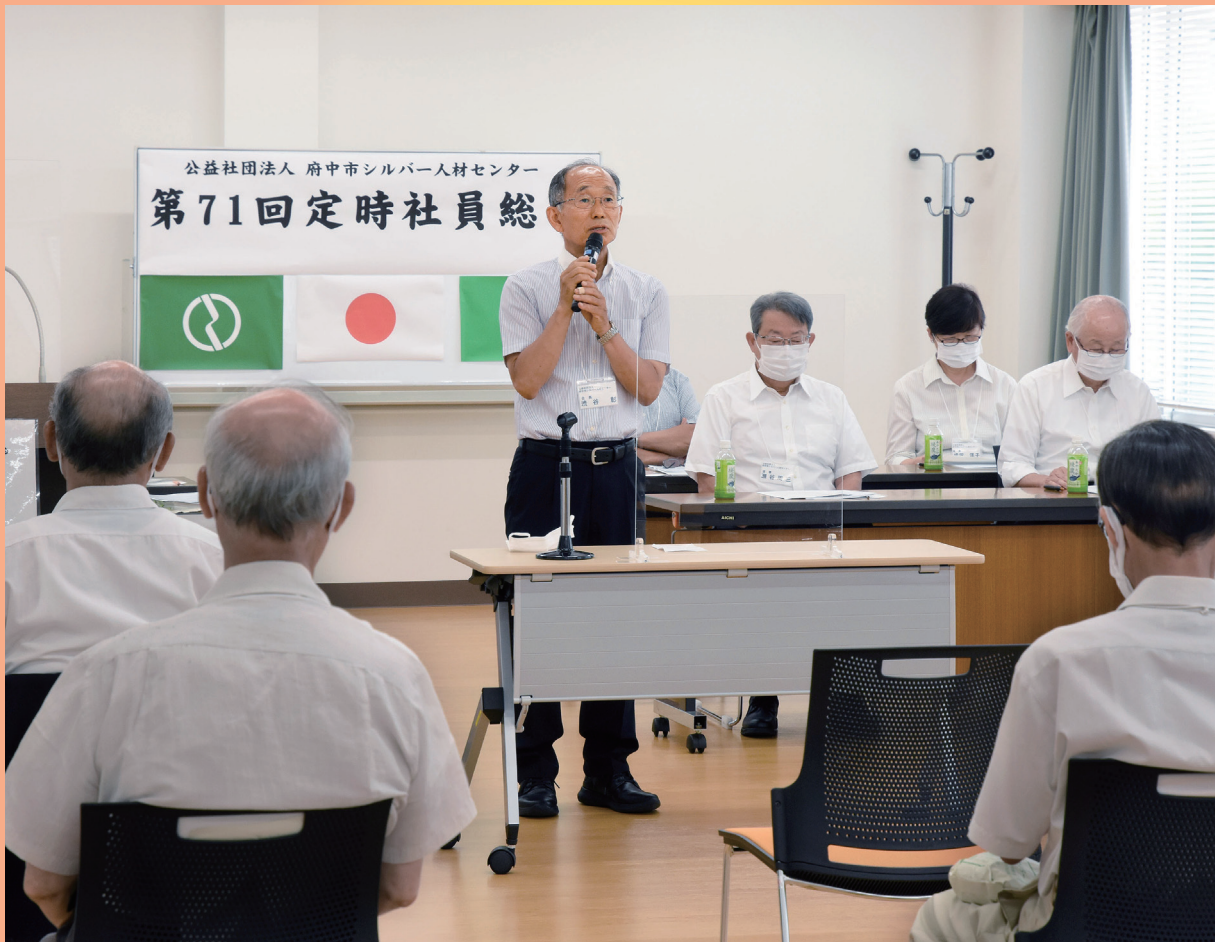
第71回定時社員総会開催

公益社団法人府中市シルバー人材センター発行/東京都府中市府中町1-30 ふれあい会館1F/TEL042-366-2322