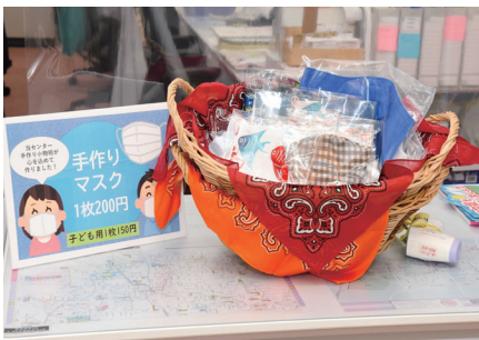
小物班作成マスク販売中