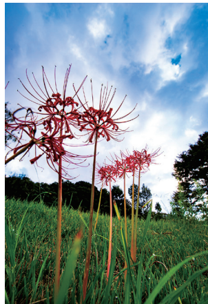
『野川公園歩道の彼岸花』 田嶋 淳さん