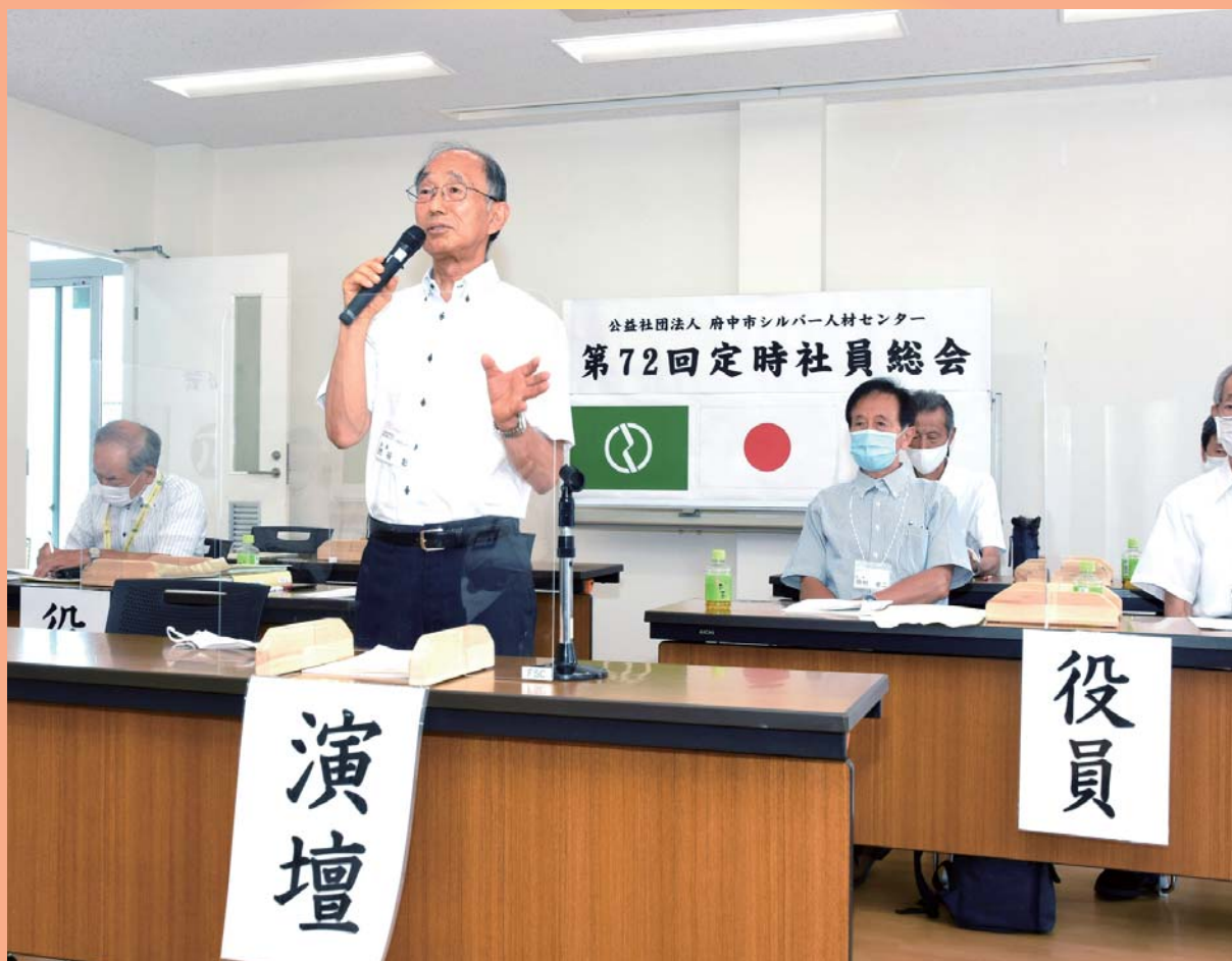
第72回定時社員総会開催

公益社団法人府中市シルバー人材センター発行/東京都府中市府中町1-30 ふれあい会館1F/TEL042-366-2322