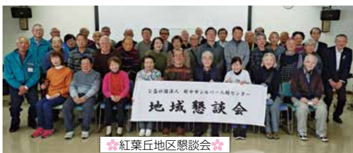
紅葉丘地区懇談会

出席した理事からは、当センターの現状と課題の説明がありました。センターの契約実績、フリーランス法の施行に伴うスマイルtoスマイル登録者の推進、就業中の物損事故防止や自転車運転中の事故防止対策等の報告がありました。また、お墓参りの代行を新規にスタートする、トライアル就業の試行など、就業の変化の説明がありました。