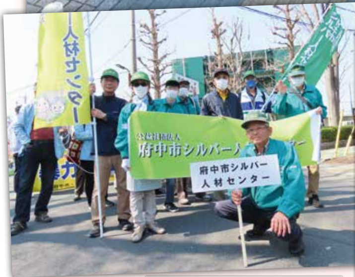
＊さくらまつり 交通安全パレード＊