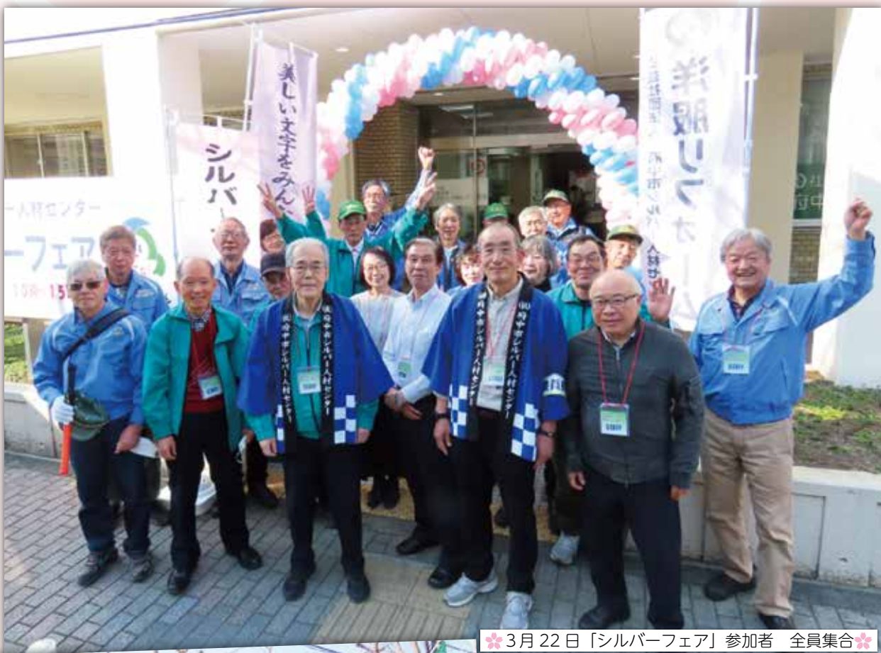
＊3月22日「シルバーフェア」参加者 全員集合＊

公益社団法人府中市シルバー人材センター発行／東京都府中市府中町 1-30 ふれあい会館 1F／TEL042-366-2322