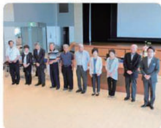
平成30年度～31年度 役員