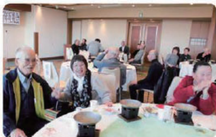
会員同士の親睦を深めていただきました

会員の親睦と交流を図るため、平成三十年一月二十九日、ホテルやまなみに於いて、新年互礼会を行いました。五十九人の大勢の会員に参加頂き、和やかな雰囲気の中、話しが弾んでいました。笑顔、笑顔で明日への英気を養って頂きました。