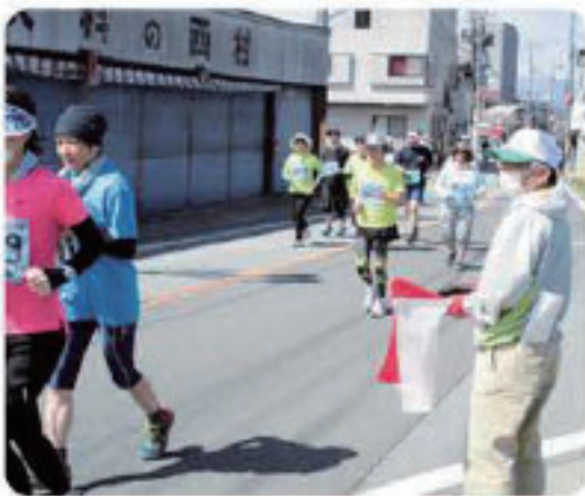
コース案内するボランティア会員

今年の大会は桃の開花とともに、大会が行われ、ボランティアの会員さんたちは、選手が通るたびに、大きな声で声援を送りながら、コース案内をしていました。