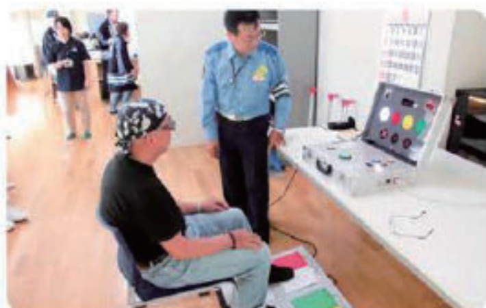
交通安全への意識が高まりました

会員の就業先への行き帰りや就業中の交通事故をなくし、交通安全意識の高揚を図るため、平成二十九年九月二十九日（金）に御坂農村環境改善センターで開催された「秋の交通安全教室」に会員二十四名が参加しました。