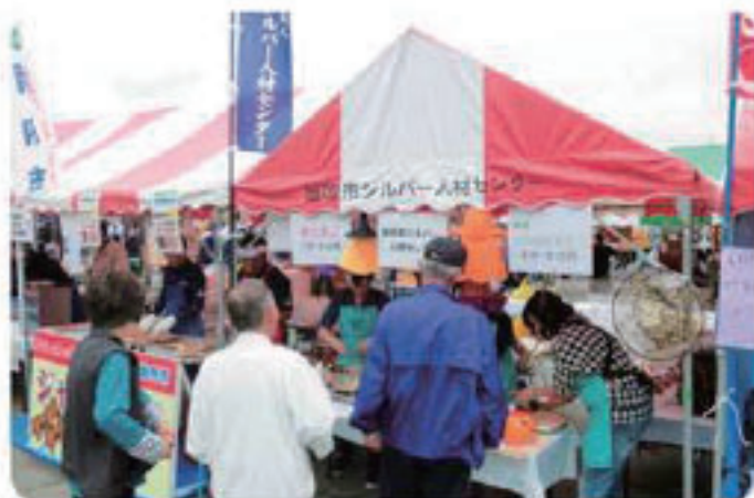
シルバーを知っていただく良い機会となりました

「笛吹市民まつり」に、当シルバー人材センターを市民の皆さんにもっと知っていただくため毎年参加しています。「煮たまご」と「味噌こんにやく」を安価で提供しながら、センターの周知を行いました。お陰様で大勢のお客様で賑わいました。