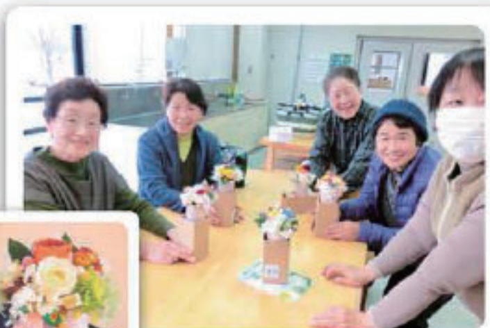
こんなに綺麗につくれました

フラワーアレンジメントは、みなさん素敵に仕上がりと、とても楽しい時を過ごすことができました。