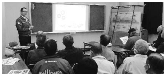
上下刃ハサミ切方式

飛び石事故が多い中「事故ゼロ」を目的に刈払機の講習会を令和6年2月20日(火)東部浄化センターにて33名が参加して開催。刈払機における基本作業(座学)と屋外での実習を実施しました。令和6年度からは新チップソー「石トバサーズ」と「無双」「カルマー式」の使用と併せ養生ネットなどを確実に「事故ゼロ」を目指す事を参加者全員で確認しました。