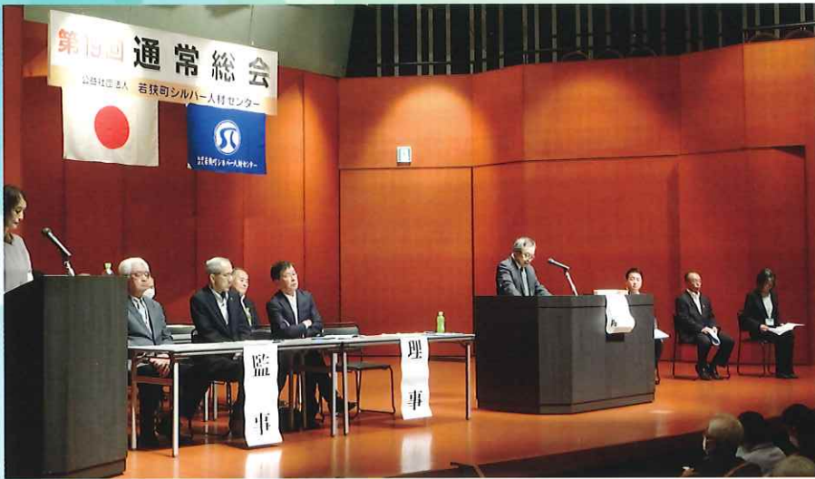
第19回通常総会来賓祝辞