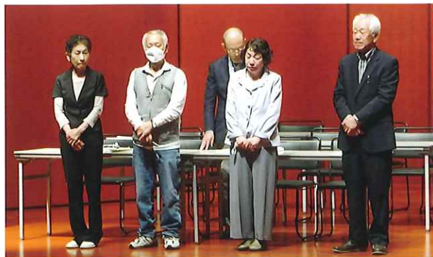
会員互助会 新役員の皆さん