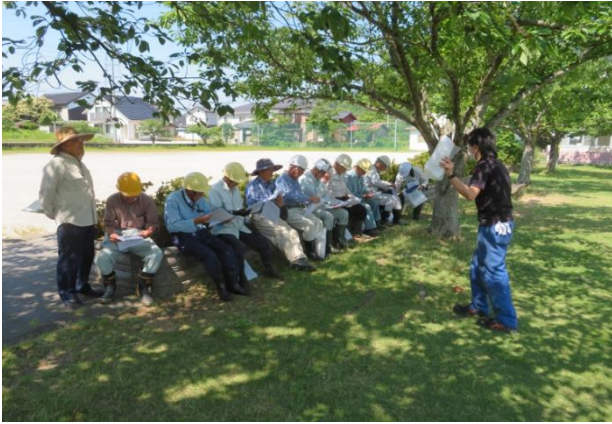
安全・適正就業パトロール内の講習

残り12センターに対して、主に剪定・伐木作業と草刈り作業を中心に安全パトロールを実施し、休憩時間に安全就業に関する資料を作業従事の会員さんに手渡し、転落、転倒防止や飛び石防止について説明し、安全就業の意識高揚を図った。