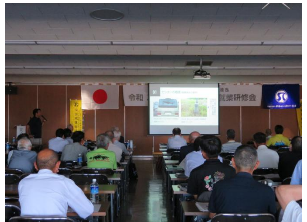
安全・適正就業研修会

例年、7月の安全就業強化月間中に県下シルバー人材センター会員と役職員を対象に安全意識の高揚と定着のための安全・適正就業研修会を開催している。令和7年度は外部講師による講話「刃物での飛び石事故対策について」を受講し、県内 3 センターからの「安全就業の取組」について事例発表、最後に参加者全員で「安全・適正就業宣言」を唱和し、無事故就業への誓いを新たにした。