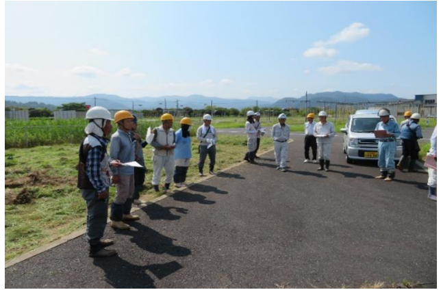
安全・適正就業推進委員会委員の安全パトロール