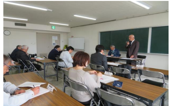
安全・適正就業推進委員会

各 SC 事務局長または安全担当職員等 15 名、連合会事務局 2 名で構成し、年 3 回開催し、年度終わりに次年度の安全・適正就業推進事業基本計画、安全・適正就業対策実施計画の策定し実行している。