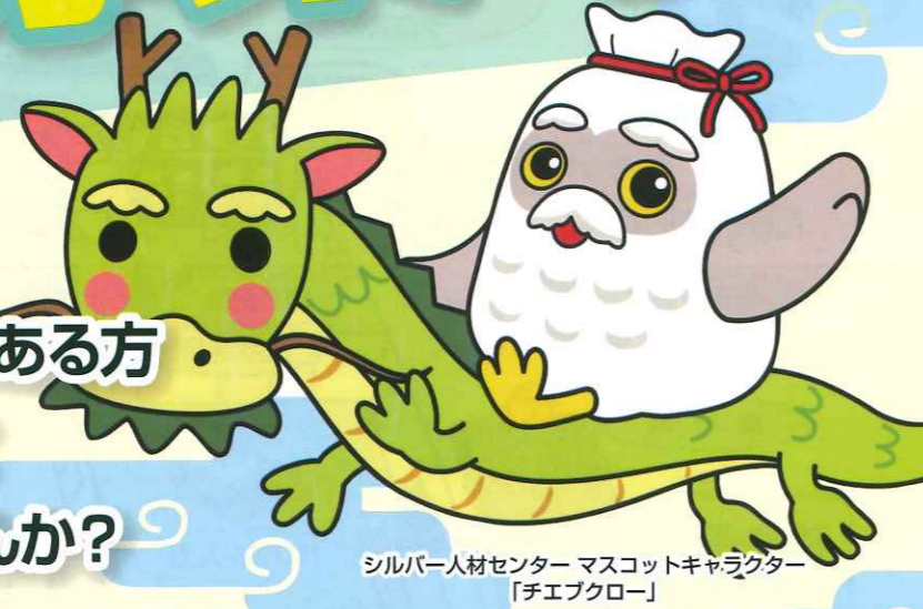
シルバー人材センター マスコットキャラクター 「チエブクロー」

福島市内にお住まいで、 60歳以上の健康で働く意欲のある方 シルバーの会員になって わたしたちと一緒に働きませんか？