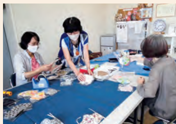
ふれあい同好会 マスク作成作業

この度は手作りマスクをお送りいただきあ りがとうございます。早速、施設管理で使用 させていただきます。 この時期、マスク不足で困っておりますた ので、大変助かります。 北部事務所「ふれあい同好会」の皆様によ ろしくお伝えください。 皆様にもお体に気をつけて新型コロナウイ ルスに負けないように頑張りましょう。