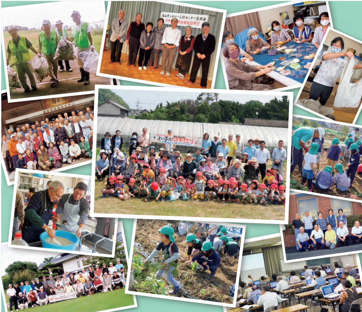
(会員互助会 活動写真)