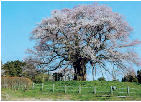
醍醐の桜 (岡山県真庭市)