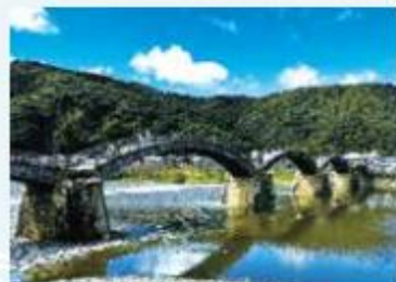
【露天風呂 錦帯橋が 目の前に】