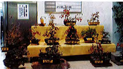
市川保治会員「老鴉柿展」 11月15日～11月23日まで