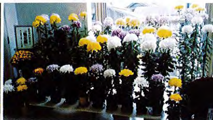
生きがいセンター「菊花展」 11月12日～11月27日まで