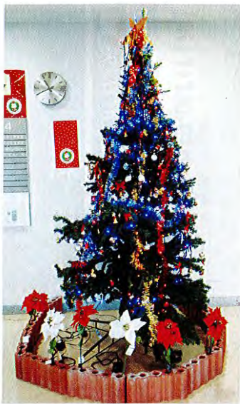
クリスマスツリー 12月5日～12月25日まで

何事も一生懸命やるのが大切で、健康と生きがいは、そんな中から生まれます。充実した人生を希望します。