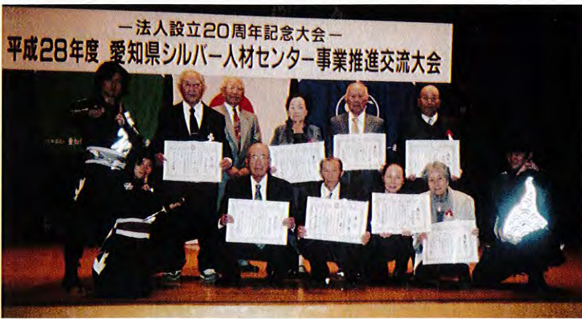
— 法人設立20周年記念大会 — 平成28年度 愛知県シルバー人材センター事業推進交流大会

人生九十年時代の今、私も今年傘寿を迎え、忘れられない記念の年となりました。今後も蒲郡市シルバー人材センターの発展に、力の限り努力したいと考えております。