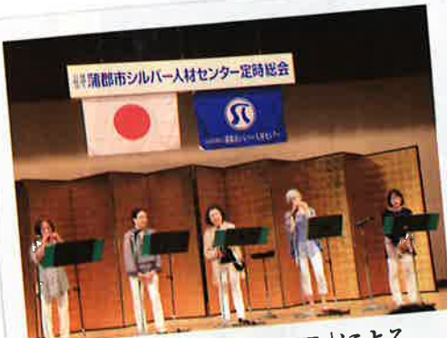
アトラクション「JADE」による オカリナ演奏