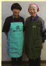
屋内作業 エプロンまたはベスト等

安全対策部会では、会員の安全就業対策として、みなさんがシルバー会員としての誇りと自覚を持って仕事をしていただくためと、シルバー会員の誠実で丁寧な仕事の成果を市民のみなさんにアピールするために、4月から、一目でシルバー会員の仕事だと分かるように作業中の服装を統一します。