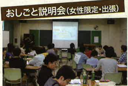
女性限定おしごと説明会(10/4開催)

人生100年時代と言われ、「超高齢化社会」「人手不足問題」に対応するために、全国シルバー人材センター事業協会は「会員100万人達成計画」を立て、5年後の令和6年度には、全国のシルバー会員を100万人に増やす目標を掲げています。そのためには、各市町村のシルバー人材センターがそれぞれ会員を増やしていくしかありません。この先、我々の子ども、孫の世代の安定した幸せな社会づくりのためにも、一緒に活躍する仲間を増やして、会員100万人を目指しましょう!