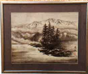
市民文化祭「水墨画展」 (11/15~17)に出品された 作品『山水』