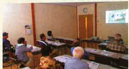
出張おしごと説明会(11/1開催) @形原公民館