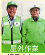
屋外作業 帽子またはベスト等

*エプロンやベストが無い場合は事務局までお申し出ください。その他、ご不明な点がありましたら、事務局までお問合せください