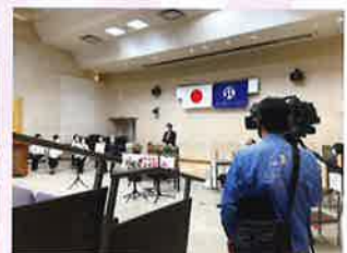
ケーブルテレビ三河湾ネットワーク取材