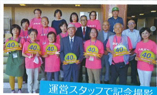
運営スタッフで記念撮影