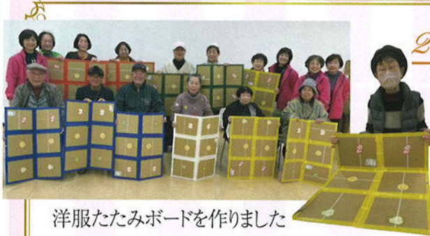
洋服たたみボードを作りました