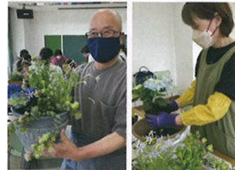
初夏に向けた寄せ植えを 作りました