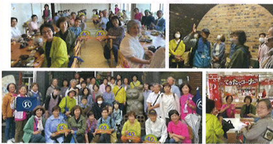
常滑市シルバー人材センターの 観光ガイドさんに案内してもらいました!