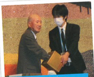
みなさん お楽しみの抽選会!