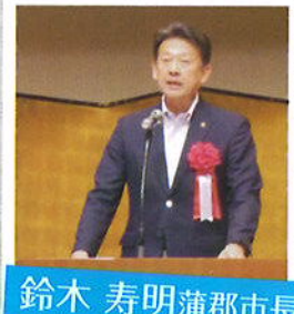
鈴木 寿明蒲郡市長