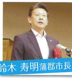
鈴木 寿明蒲郡市長