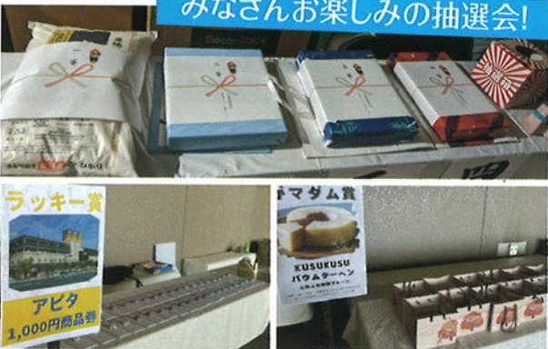
みなさんお楽しみの抽選会!