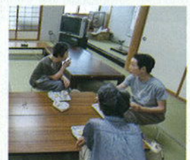
スタッフがセレクトしたBGMが流れ、リラックスできるサロンになっています。