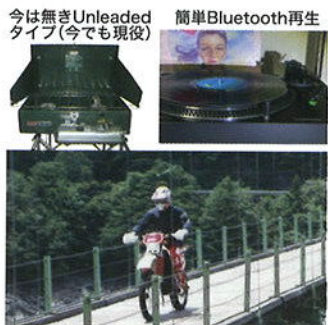
今は無きUnleadedタイプ(今でも現役) 簡単Bluetooth再生