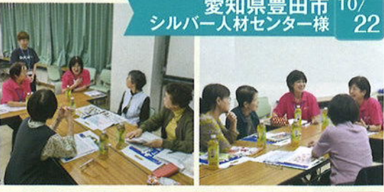
愛知県豊田市 10/22 シルバー人材センター様