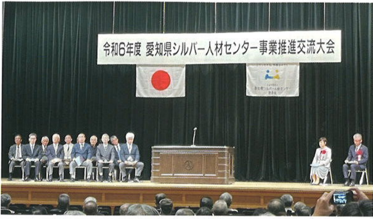
受賞者のみなさん

長年にわたり、シルバー事業の発展に貢献された会員の方に対して贈られ、蒲郡市では県知事表彰2名、連合会会長表彰9名が受賞されました。おめでとうございます。