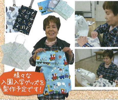
様々な入園入学グッズを製作予定です!

今までは発注者から生地を持ち込んでいただき製作していましたが、今後は生地選びをする暇もないママさんのニーズに対応するため、既製品の販売をすることにしました。