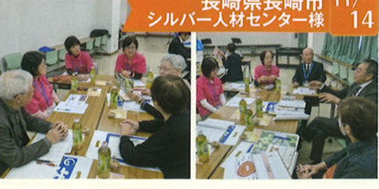
長崎県長崎市 11/14 シルバー人材センター様