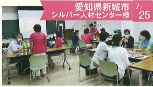
愛知県新城市 7/25 シルバー人材センター様