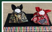
作ろう会(5月・8月・9月・10月・11月・1月)