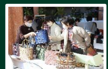
ハンドメイドマルシェ (6月・7月・9月・10月・11月・3月)