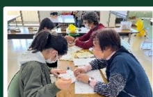
寺子屋ボランティア (3月)

みんなで和気あいあいと楽しく活動しています。新しい仲間を募集中です。ぜひ、一緒にものづくりを楽しみませんか。