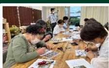
虫よけトンボ作り (6月～)