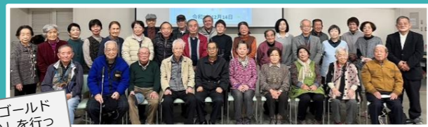
年に2回「ゴールド会員の集い」を行っています