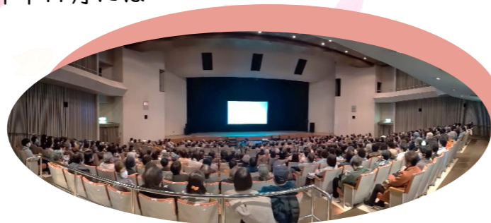
3月7日の「映画上映会」は、会員・市民の皆さんで蒲郡市民会館中ホールが満席になりました

来年度からも、みなさまの人生がますます輝くように、精一杯サポートさせていただきますので、何卒よろしくごお願い申し上げます。