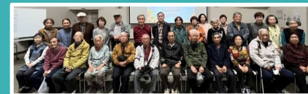
11/15開催の「ゴールド会員の集い」に参加された皆さん