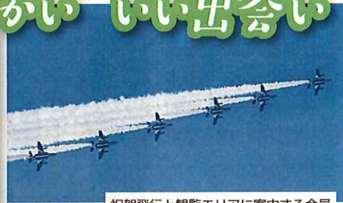
祝賀飛行と観覧エリアに案内する会員