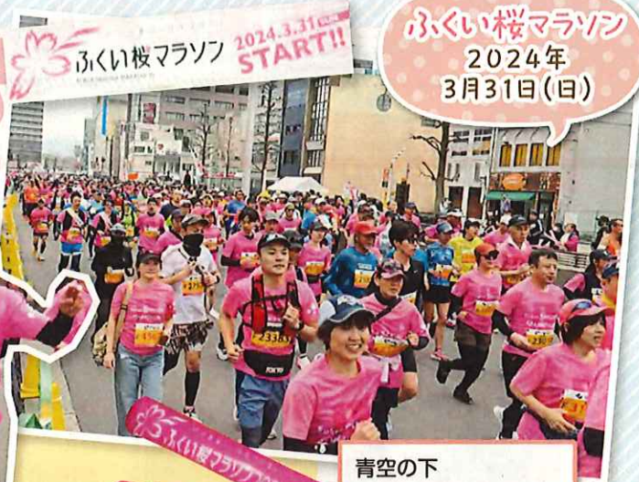
青空の下 1万3,657人スタート