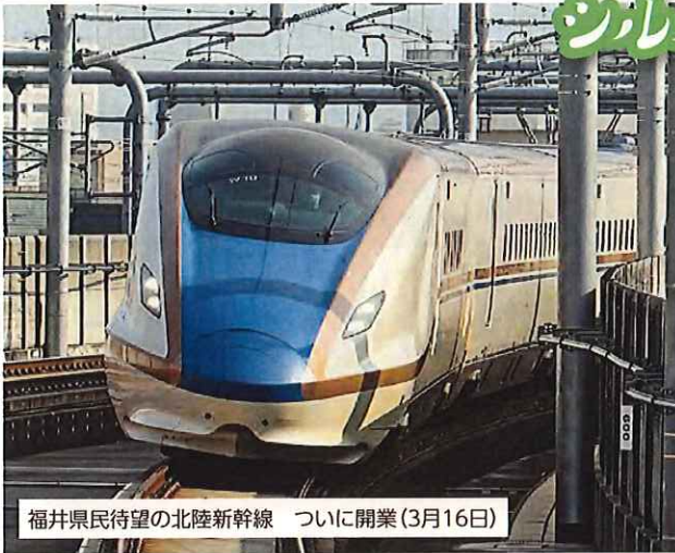
福井県民待望の北陸新幹線 ついに開業(3月16日)