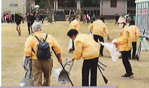
中央公園付近 大勢の参加者に会場を美しく清潔に