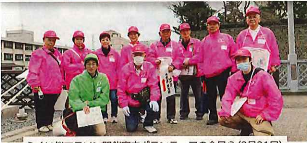
ふくい桜マラソン開催案内ボランティアの会員ら(3月31日)