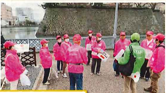
案内ボランティア 桜色の上着・帽子で勢揃い