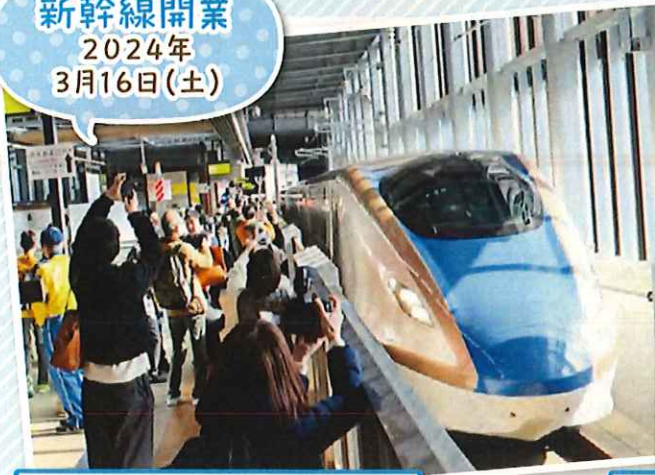
待ちに待った新幹線 福井駅で みんなで出迎え ようこそ