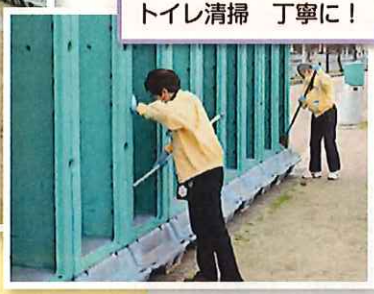
トイレ清掃 丁寧に!