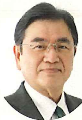
福井市長 西行 茂