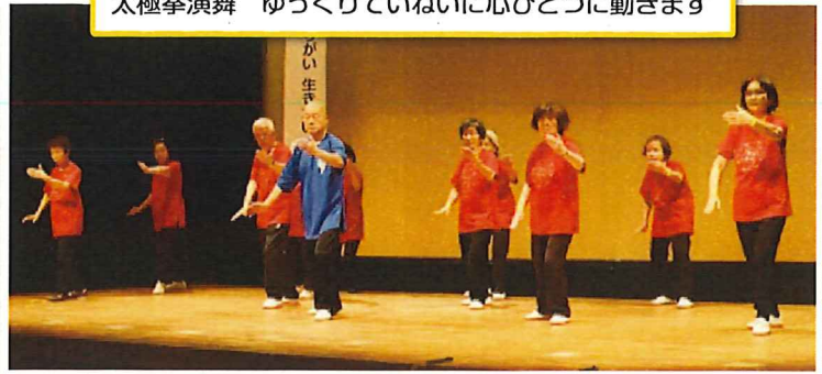
太極拳演舞 ゆっくりていねいに心ひとつに動きます