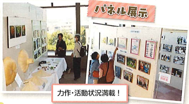
力作・活動状況満載！