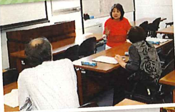
入会説明・就業相談会