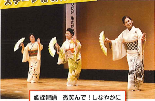
歌謡舞踊 微笑んで!しなやかに