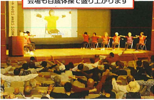
会場も百歳体操で盛り上がります