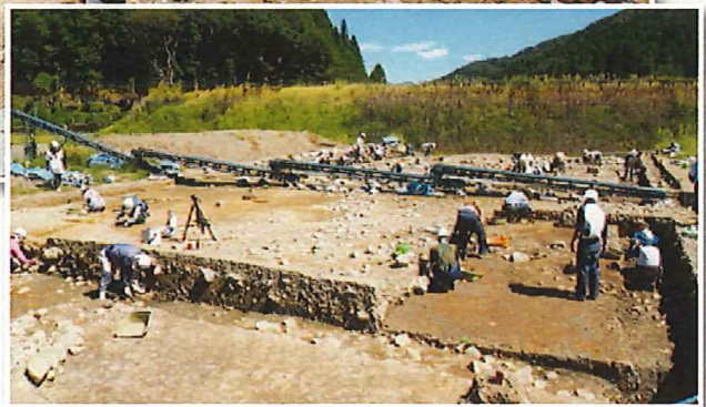
▲福井市の一乗谷朝倉氏遺跡発掘調査の現場で作業をする会員ら