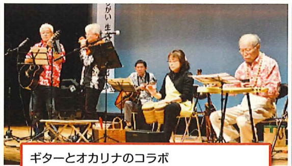
ギターとオカリナのコラボ 会場の方と一緒に懐かしい歌も歌いました。