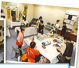
探します！ 欲しいものがいっぱい！