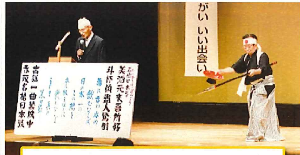
歌謡吟 吟詠と舞のコラボ「名槍日本号」お見事!