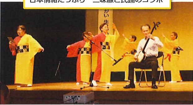
日本情緒たっぷり 三味線と民謡のコラボ