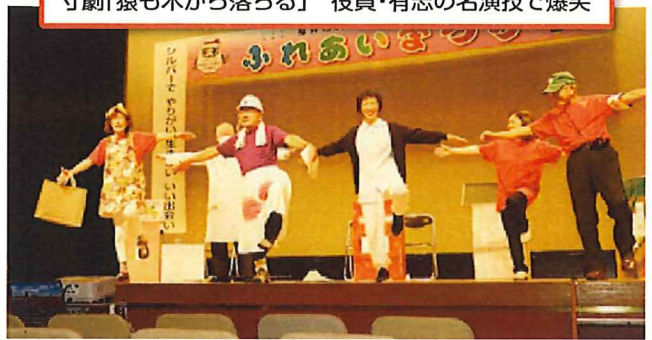
寸劇「猿も木から落ちる」 役員・有志の名演技で爆笑