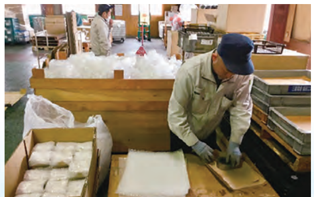
島田工場梱包作業風景