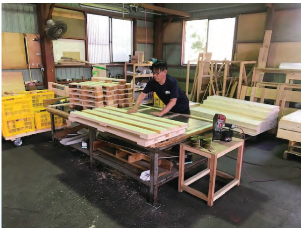
坂本製函工場作業風景

当社のメイン事業であります木製パレット木箱製造工場は、皆さん定年後も継続して勤めていただいているため、平均年齢が60歳を超えております。