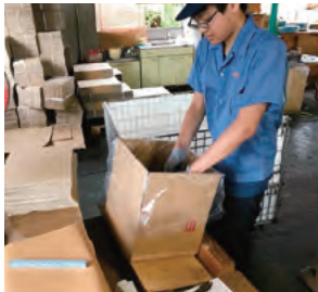
島田工場梱包作業風景

今後、労働人口の減少が見込まれる中においては、高齢者の方であっても当社で働きたいという気持ちをお持ちであれば、年齢を問わずに採用させていただくつもりです。