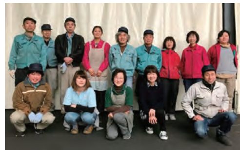
本社段ボール工場従業員