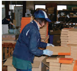
本社段ボール工場作業風景