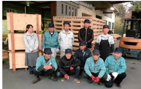
坂本製函工場従業員

高齢者の方が再雇用制度によって働いていただく場合でも、基本的にはフルタイムでの勤務をお願いしていますので、賃金は定年時と比べ