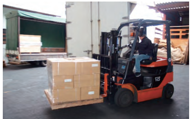
本社段ボール工場作業風景