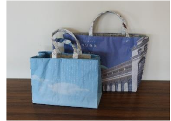
▲女性委員会で製作